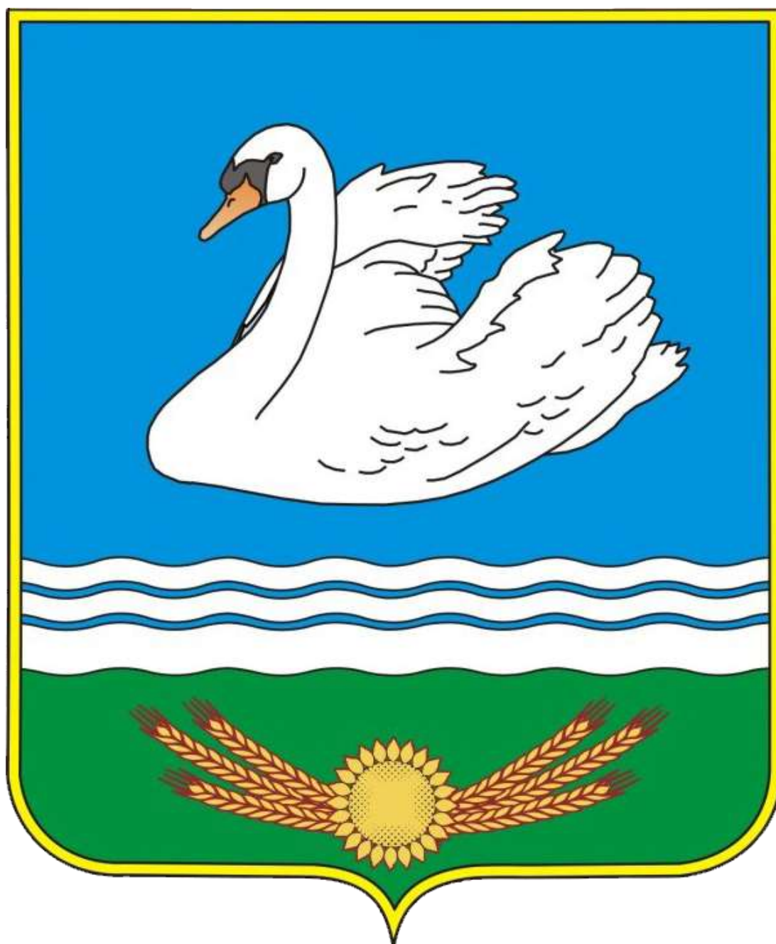
Рисунок Герба муниципального образования Раздольненский район Республики Крым в цветном варианте

Приложение 1 к Положению о гербе муниципального образования Раздольненский район Республики Крым