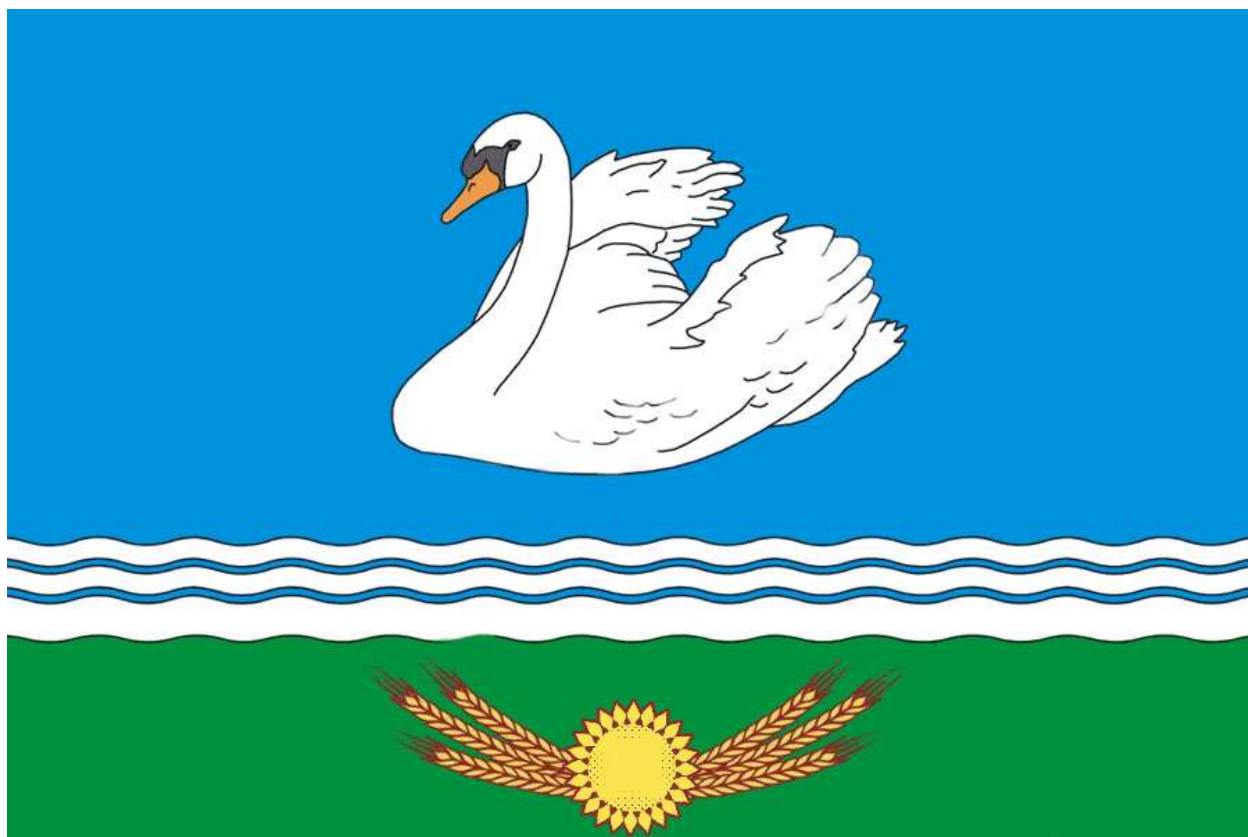
Рисунок Флага муниципального образования Раздольненский район Республики Крым

Приложение 1 к Положению о флаге муниципального образования Раздольненский район Республики Крым